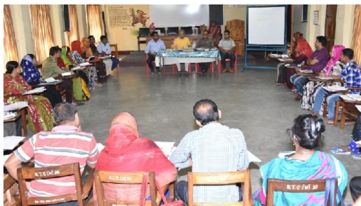
L'assistente direttore del programma tiene il discorso finale in chiusura dell'incontro